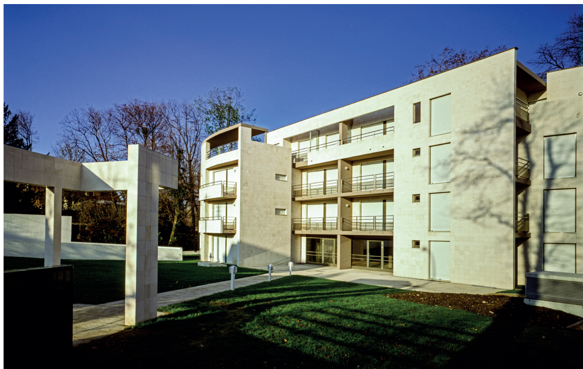
LA PERSPECTIVE D'ACCÈS DEPUIS LE BOULEVARD