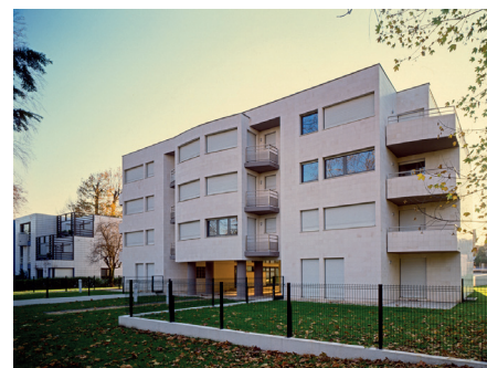
FAÇADE SUR LE LAC, À U FOND LE N°24

MATÉRIAUX DE FAÇADE: PIERRE PELLICULAIRE COLLÉE